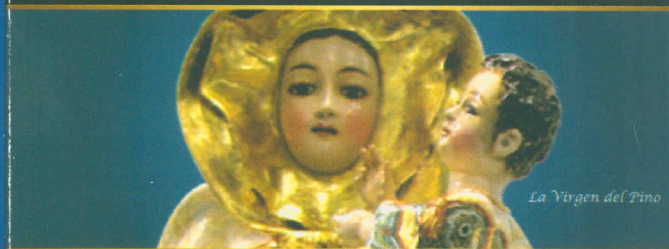
La Virgen del Pino