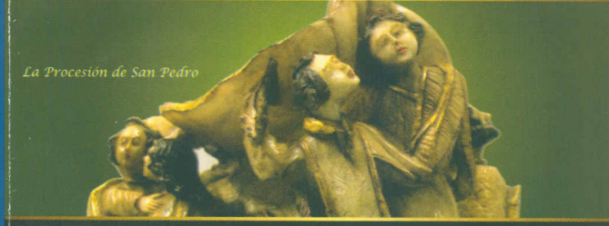
La Procesión de San Pedro