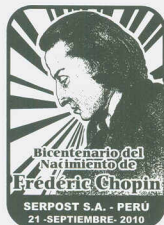
Matasellos de Primer Día de Emisión

Serpost El Correo del Perú EMPRESA DEL SECTOR TRANSPORTES Y COMUNICACIONES